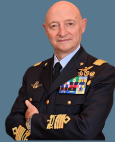
GEN. S.A. LUCA GORETTI

Ministro per la Protezione Civile e le Politiche del mare